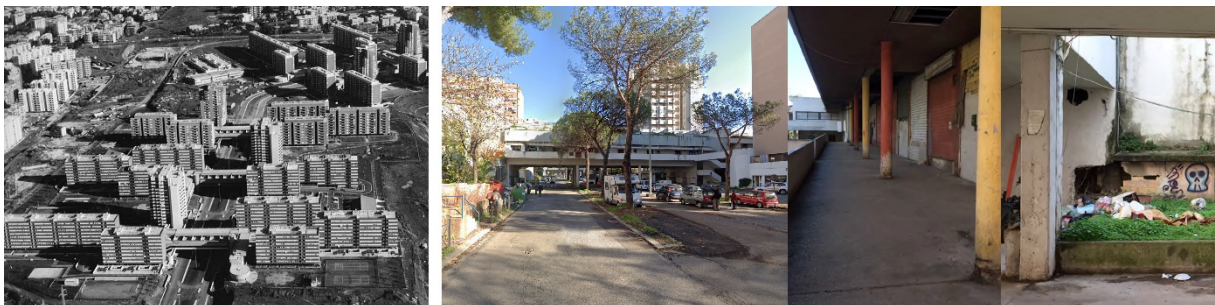
Figura 4: vista aérea del sistema urbano del barrio Laurentino 38 (años '80). Imágenes del estado de degradación y de abandono de los 'Puentes' (2020).

En este caso, más que la quiebra de la idea proyectual emerge la quiebra de su gestión y de la falta de activación de los servicios; como consecuencia, los puentes, de ser polaridad magnéticos se han dejado vacíos, determinando de hecho la estructura de un barrio dormitorio . Los volúmenes abandonados han sido ocupados abusivamente y sus habitantes privados de los servicios previstos. El 'Puente' que representaba la metáfora de la unión entre dos lugares y del encuentro entre distintas etnias, en cambio ha generado el efecto contrario; ha sido división, aislamiento y degradación (fig. 4).