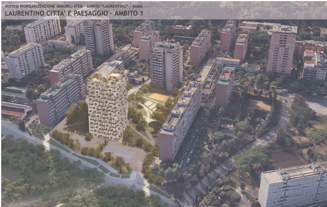
Figura 5: Progetto Laurentino Città e Paesaggio (ATER), proyectista: Raffaele Giannitelli.