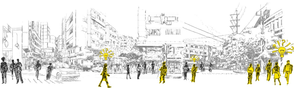
Figura 7: Los ciudadanos como informadores y participantes activos en la regeneración urbana, para la revitalización de los espacios abiertos de la ciudad.

El proyecto participado 10 como premisa teórica representa una válida solución al recupero inclusivo de los espacios relacionales reconocidos del ciudadano y a la evaluación de los procesos proyectuales decisionales que ofrecen una nueva resiliencia al paisaje urbano. Sin embargo, los resultados del proceso participado no siempre son los deseados, porque las soluciones que responden a las exigencias de los ciudadanos están privadas del punto de vista multidisciplinar que la ciudad impone. El valor de la palabra al unísono conduce a intervenciones urbanas fraccionadas, lejanos de las expectativas de la regeneración; por lo contrario, mayor valor tiene la voz coral, cuando transfiere valores sociales y culturales, imagen de una comunidad que vive el lugar urbano. La voz de la colectividad proclama una posición que ciertamente se enfoque en los aspectos sociales comunitarios, pero parece aún lejana de la visión multiescalar que caracteriza la regeneración urbana.