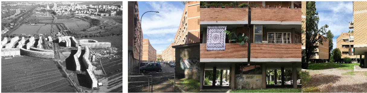
Figura 1: vista aérea del barrio de Decima (1965). Imágenes de las actuales condiciones de los espacios comunes (2020).

de libertad y respiro que se filtraba una identidad sincera, suspendida en aquella mezcla de hechos e invenciones artífices luego de su memoria. Hoy aquella condición, aquella respuesta social se ha transformado, esbozando un escenario urbano en espera (fig. 1).