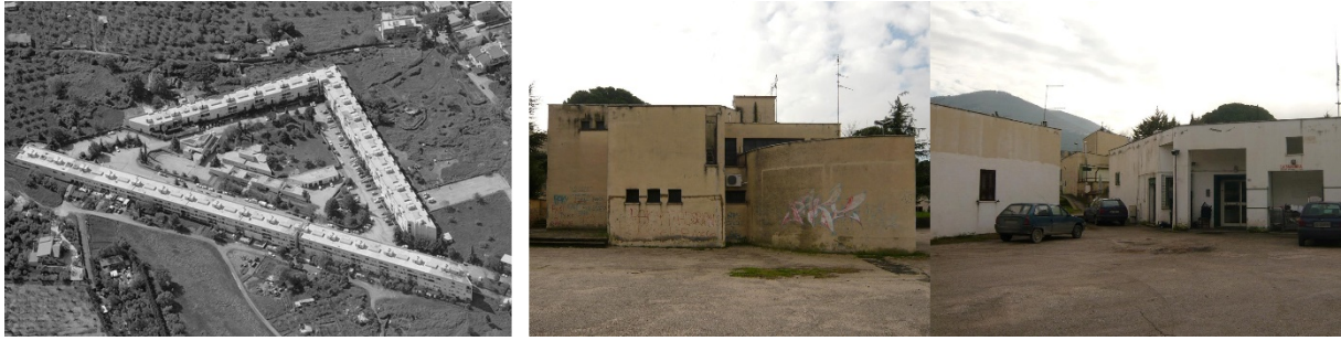
Figura 3: el sistema urbano del barrio 'Adrianelle'. Imágenes del estado de abandono del bloque central de los servicios (2010).

Atravesando el barrio Laurentino 38 5 , se percibe hoy la quiebra de una previsión. Es el lugar de la conexión denegada, donde los espacios destinados a servicios en el tiempo se han convertidos en residuales más que conectivos, cuyo destino es la demolición.