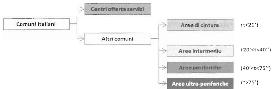
Grafico 1. classificazione “per livelli di perifericità”.

dei territori (in senso spaziale) rispetto alla rete di centri urbani influenza – anche a causa delle difficoltà di accesso ai servizi di base – la qualità della vita dei cittadini e il loro livello di inclusione sociale; 3) le relazioni funzionali che si creano tra poli e territori, più o meno periferici, possono essere assai diverse a seconda delle tipologie di area considerate.