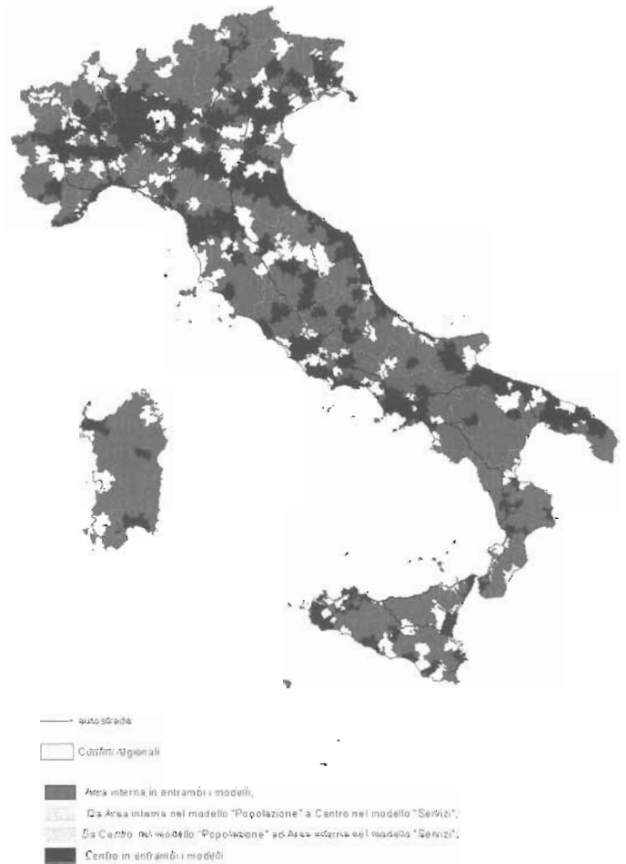
Fig. 2. Mappa delle Aree Interne basata sul criterio della popolazione e dell’offerta di servizi. Fonte: DPS, 2014, p. 27.

Su questa base, è stata avviata la strategia che finanzia lo sviluppo delle aree interne.