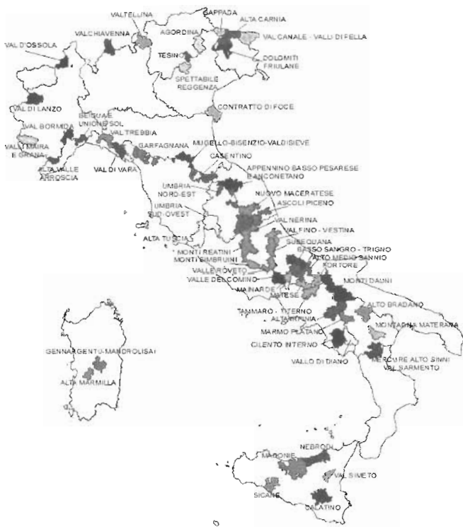
Fig. 3. Aree progetto da ammettere al finanziamento. Fonte. Relazione CIPF, 2015, p. 13.