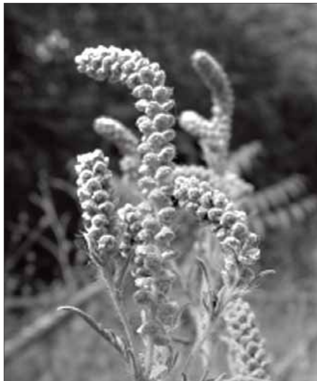
FIG. 1- Inflorescenza di Ambrosia artemisiifolia L.

Nel Lazio Ambrosia artemisiifolia L. viene citata da Pignatti, da Anzalone nel suo Prodromo del 1984 in cui viene riportata come “più o meno rara”. Successivamente è considerata molto rara da Anzalone (1996-1998), arrivando ad ipotizzarne addirittura la scomparsa, dando per “non più rinvenuta” tale specie negli ultimi trenta anni.