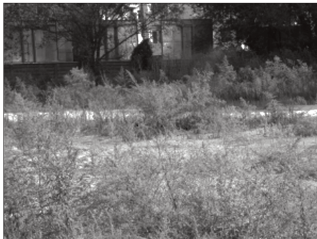
FIG. 2 - Veduta del sito di piazzale Clodio con esemplari di Ambrosia artemisiifolia L.

Nel 2004 Anzalone ( in verbis ) ha trovato una popolazione di A. artemisiifolia a Roma, nei pressi del Pa-