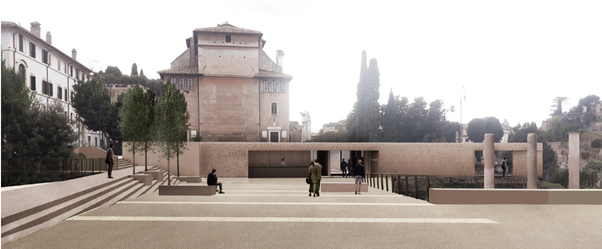
Fig. 4. Nuovo accesso Foro Romano –Palatino da Via dei Fori Imperiali (2019-2020). Prefigurazione.

che ritenersi oramai acquisita. Un'operazione di ri-definizione dei margini diviene pertanto prioritaria per la determinazione di un nuovo fronte urbano ad oggi frastagliato e incompiuto. Per noi l'edificio doveva pertanto rispondere a tre prioritarie necessità: creare una quinta urbana da Via Cavour senza assumere le sembianze di un terminale prospettico, operare sul margine di scavo definendo il recinto archeologico ed in ultimo, delineare un nuovo basamento per San Lorenzo in Miranda, ovviando definitivamente al ribaltamento di fronte avvenuto a seguito della creazione del nuovo asse urbano. In tale direzione la scelta è stata quella di un 'edificio-sostruzione' che, disegnato intrecciando le linee generatrici dell'impianto dell'antico Tempio di Antonino e Faustina e del Tempio della Pace, definisce una nuova porta urbana per la città antica.