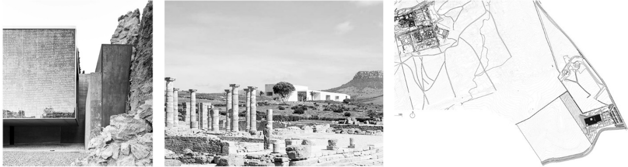
Fig. 2. Centro museale del Teatro Romano di Malaga (2010), Centro visitatori del sito archeologico di Baelo-Claudia (1999), Polo museale di Madinat Al Zahra (2009).

Alla luce della ricerca personalmente condotta nel 2018 relativa ai siti patrimoniali archeologici in Andalusia, lo studio comparativo di tre progetti spagnoli, circoscritti per coerenza di indagine al decennio 1999-2010, mette in evidenza differenti approcci operativi all'interno del programma museale sia in termini di fruizione che di