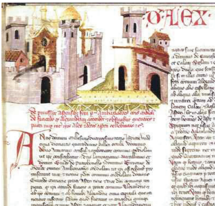
Figura 2. Miniatura a inchiostro e colore di Alessandria nel Codex Astensis qui de Malabayla communiter nuncupatur , 1353 (Archivio di Stato di Asti, anche in < http://urbanlogin.cultural.it >).