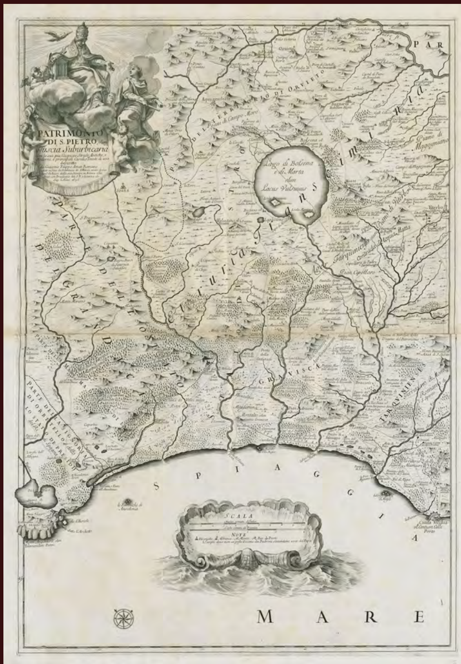
Fig. 1. Giovanni Giacomo de' Rossi, Patrimonio di S. Pietro, olim Tuscia Suburbicaria, con le sue più cospicue Strade Antiche e Moderne , Roma 1696.