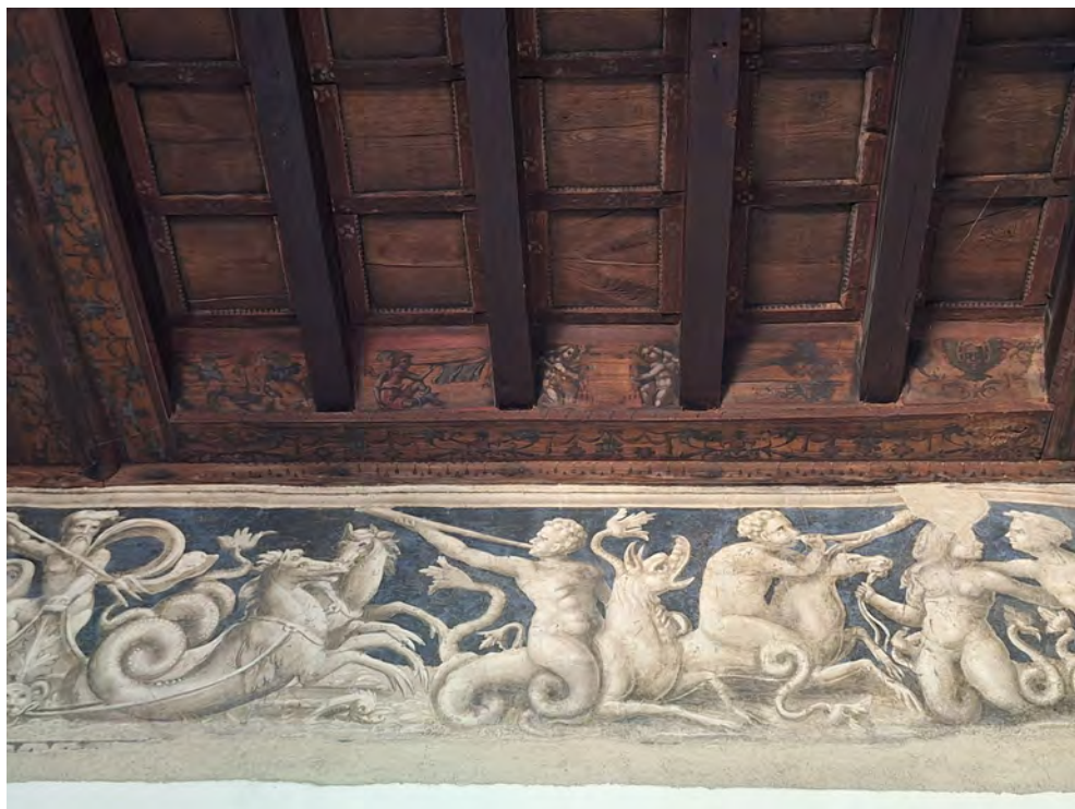
Fig. 6 Gradoli. Palazzo Farnese, Salottino d'attesa, Scuola di Raffaello (XVI secolo), Lotta di tritoni , particolare, 2024.