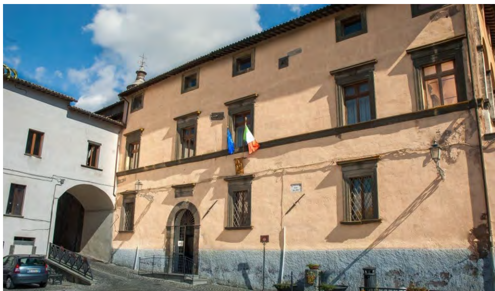
Fig. 2. Latera. Palazzo Farnese, prospetto occidentale, 2024.