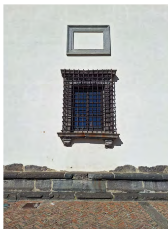
Figg. 5a, 5b. Gradoli. Palazzo Farnese, prospetto e particolare, 2024.