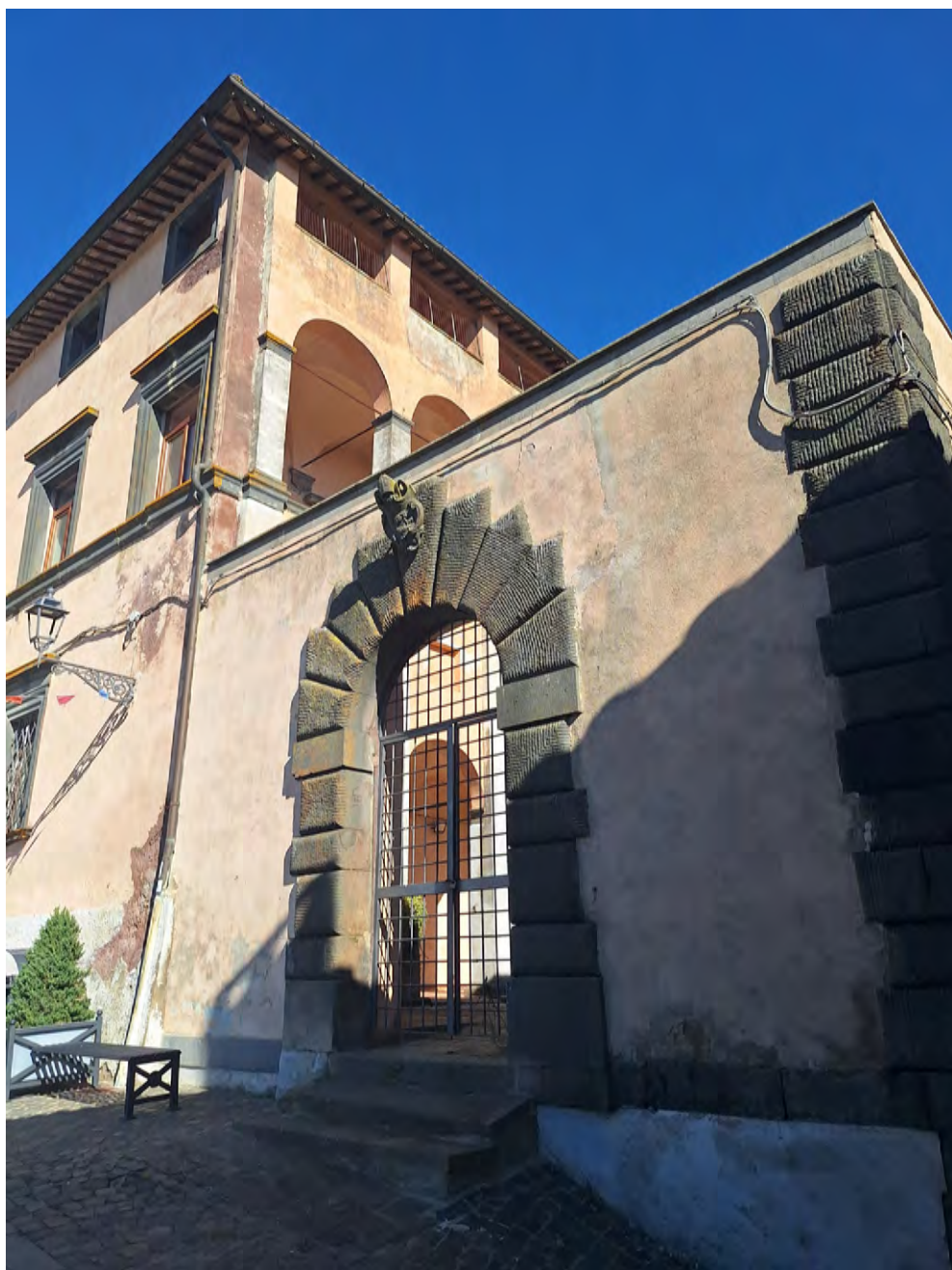
Fig. 3. Latera. Palazzo Farnese, cortile, 2024.