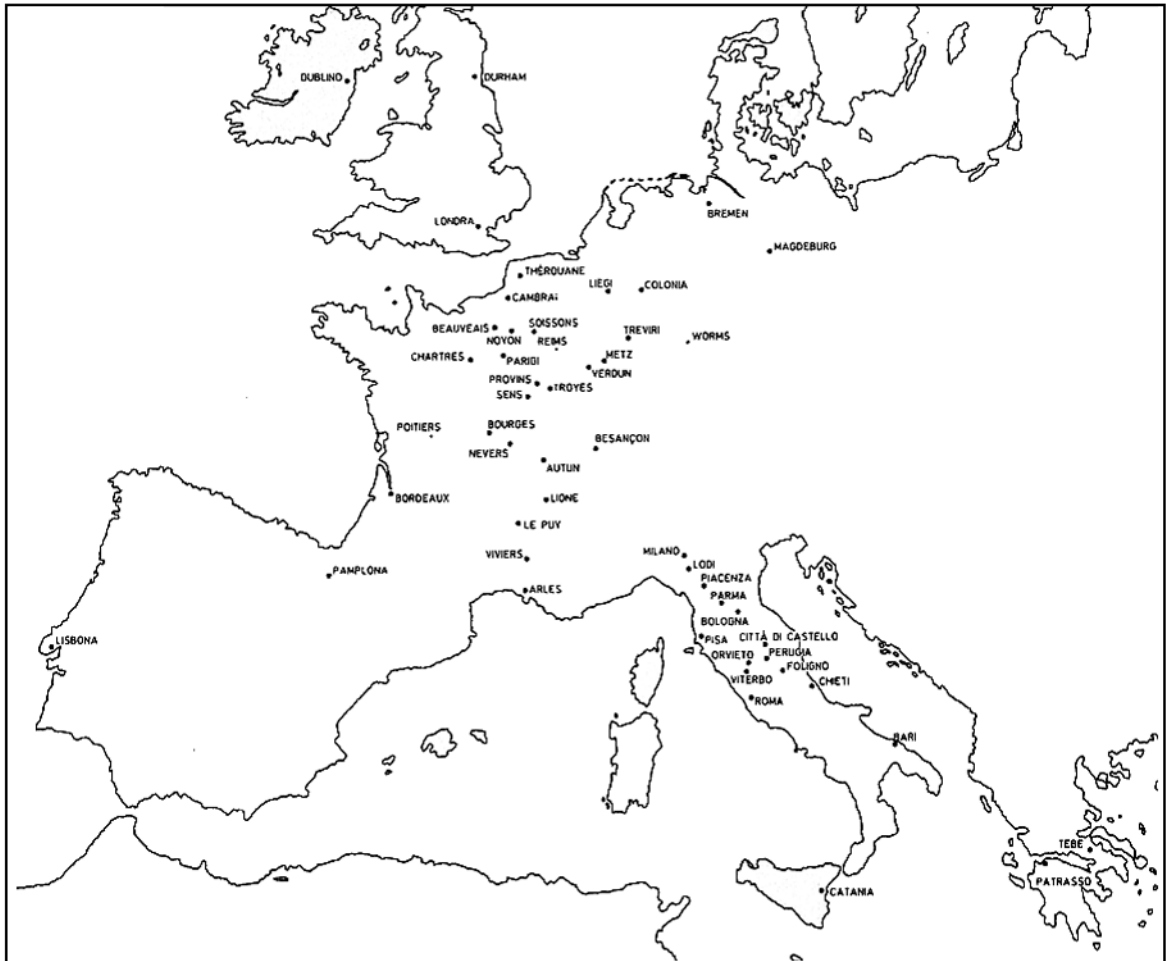
carta 4: città e piazze finanziarie in cui sono attivi mercanti romani